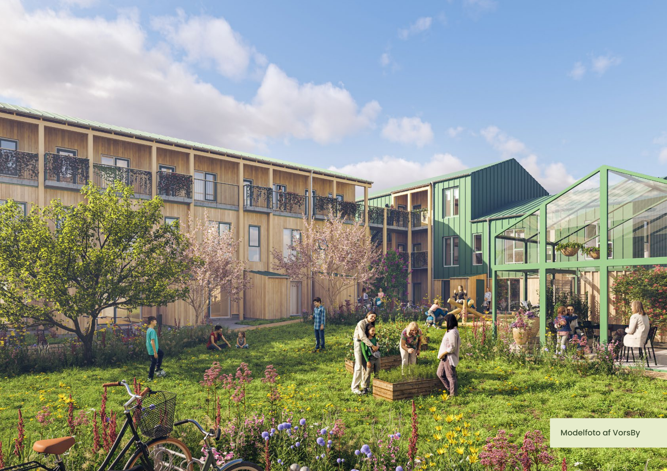
Modelfoto af VorsBy