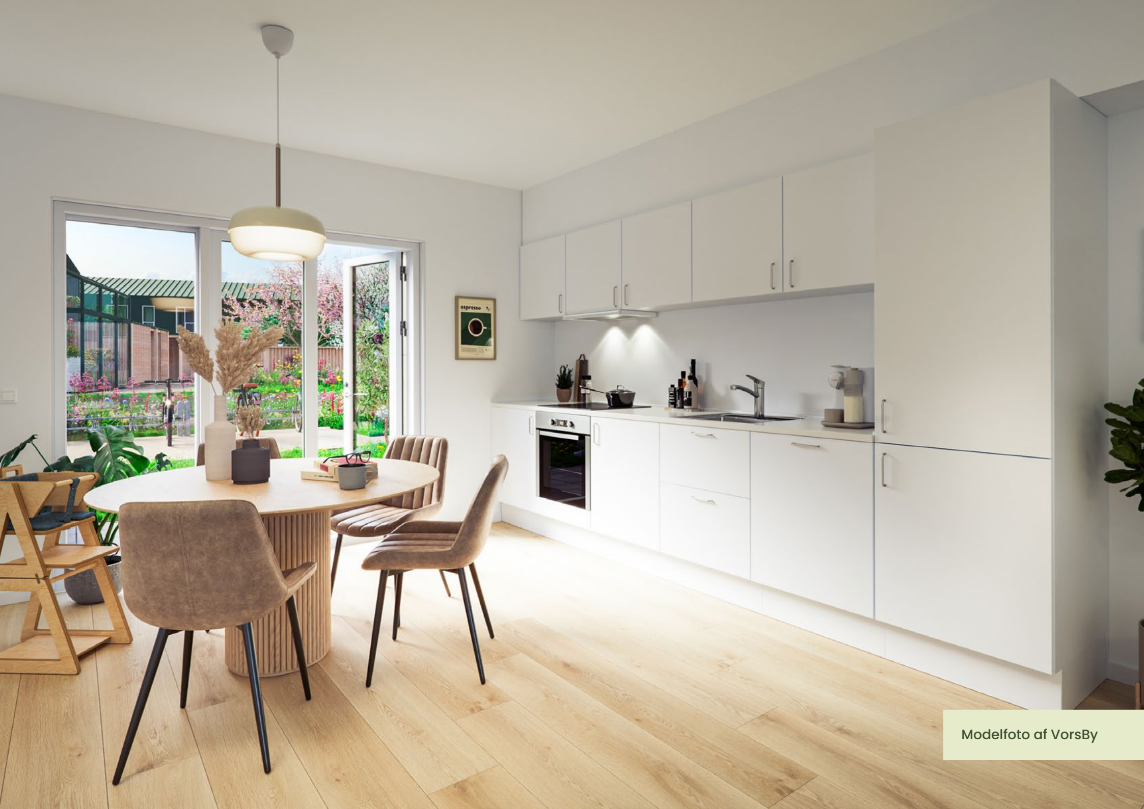
Modelfoto af VorsBy